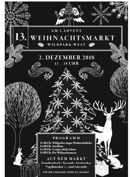
Das Plakat zum 13. Weihnachtsmarkt in Wildpark-West Grafik: Ralph Berek

Wir sind gespannt, ob der Weihnachtsmann wieder eine Mitfahrgelegenheit gefunden hat oder diesmal zu Fuß kommt.